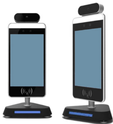
Supporto da tavolo

I supporti dotati di passaggio cavi interno e barra LED rendono la soluzione Thermo Access TC-8 ideale anche in installazioni presso ristoranti, hotel attirando l'attenzione degli ospiti per la misura.