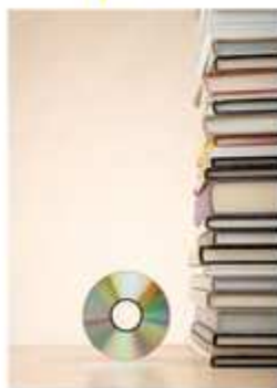
Dati BVA e Arthur D. Little